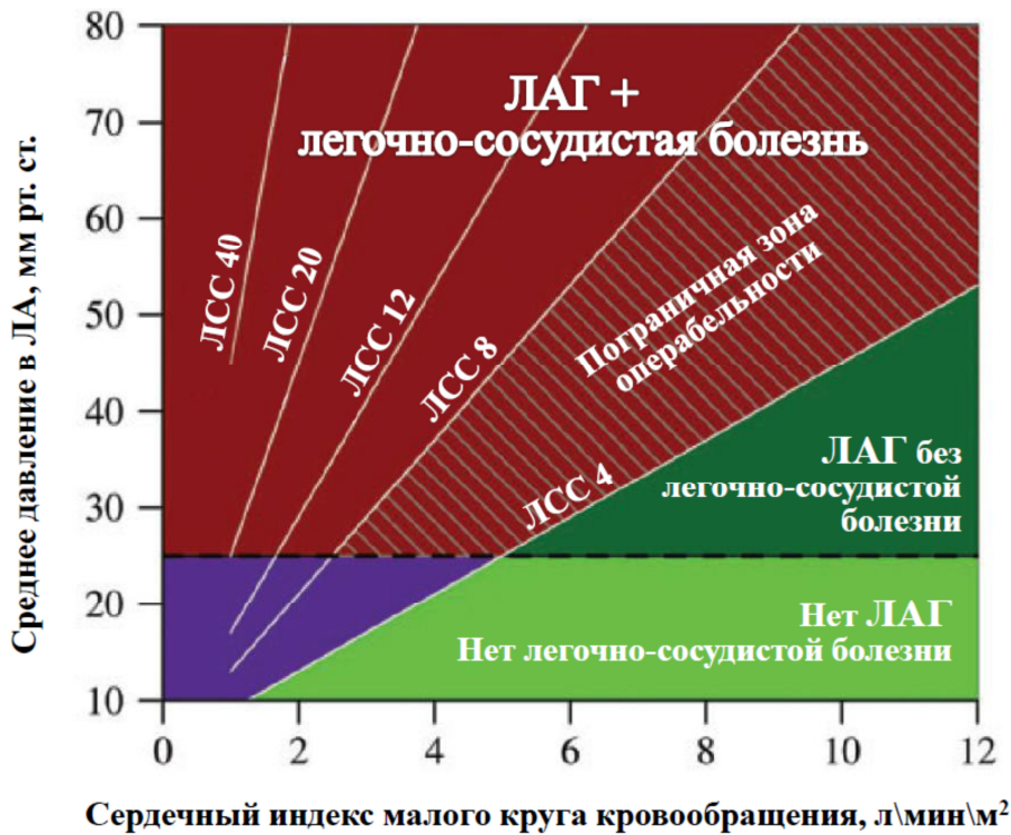
Рисунок 1. Взаимосвязь между легочным кровотоком, средним давлением в ЛА и ЛСС у больных с ВПС. У больных с артерио-венозным сбросом крови ЛАГ диагностируется при среднем давлении в ЛА \geq 25 мм рт. ст. и может сопровождаться (темно-красная область) или не сопровождаться (темно-зеленая область) легочно-сосудистой болезнью. Взрослые больные с ЛСС > 8 ед. Вуда/м 2 обычно являются неоперабельными и могут рассматриваться в качестве кандидатов на ЛАГ-специфическую терапию. У больных с ЛСС от 4 до 8 ед. Вуда/м 2 (темно-красная заштрихованная зона) требуется индивидуальная оценка операбельности.

У больных у унивентрикулярной гемодинамикой и низким легочным кровотоком после операций «обхода» правых отделов сердца может наблюдаться увеличение ЛСС без выраженного повышения среднего давления в ЛА (фиолетовая зона) [7].